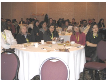
Forum santé 2010