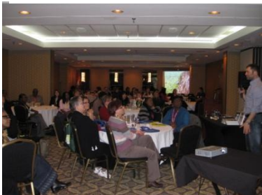
Les délégués du Forum